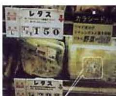
国内スーパーのレタス