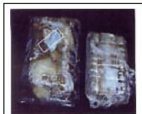
中国からの輸入椎茸

「カラシード」は セロファンポリに包 まれているため、ガ スを徐々に放出して いくので、永く効果 を發揮します。