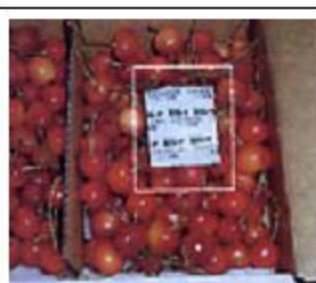
山形産さくらんぼ